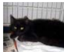
BERTIN , llegó atropellado y tuvimos que amputarle una patita.