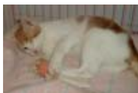
JAZZ , perdió un ojito