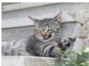
TUCO , tuvo una infección en la boca con 2 meses y perdió parte del labio superior.