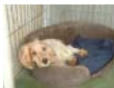
SILVANA , positiva en Lismania