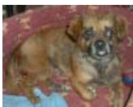
MIKY , un viejete con su carácter refunfuñón