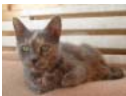
LOOP , 8 años, operado de displasia