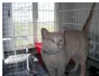
NEMO , sus anteriores dueños le arrancaron sus uñas