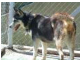
DALI , después de esperar 3 largos años por fin ha salido adoptada!

Son muchos los perros y gatos que son abandonados por sus amos con una edad avanzada, algunos incluso enfermos fruto de su falta de cuidados y otros son encontrados en la calle en muy mal estado. Por desgracia, la mayoría se quedan pasa siempre en la Lliga, porque nadie se fija en ellos o simplemente cuando conocen su edad frenan la posible adopción, pero de vez en cuando llega alguien a quien no le importa la perfección y le da una oportunidad de volver a sonreír rodeados de familia y buena vida. A todos ellos ¡mucho suerte en vuestro nuevo hogar!